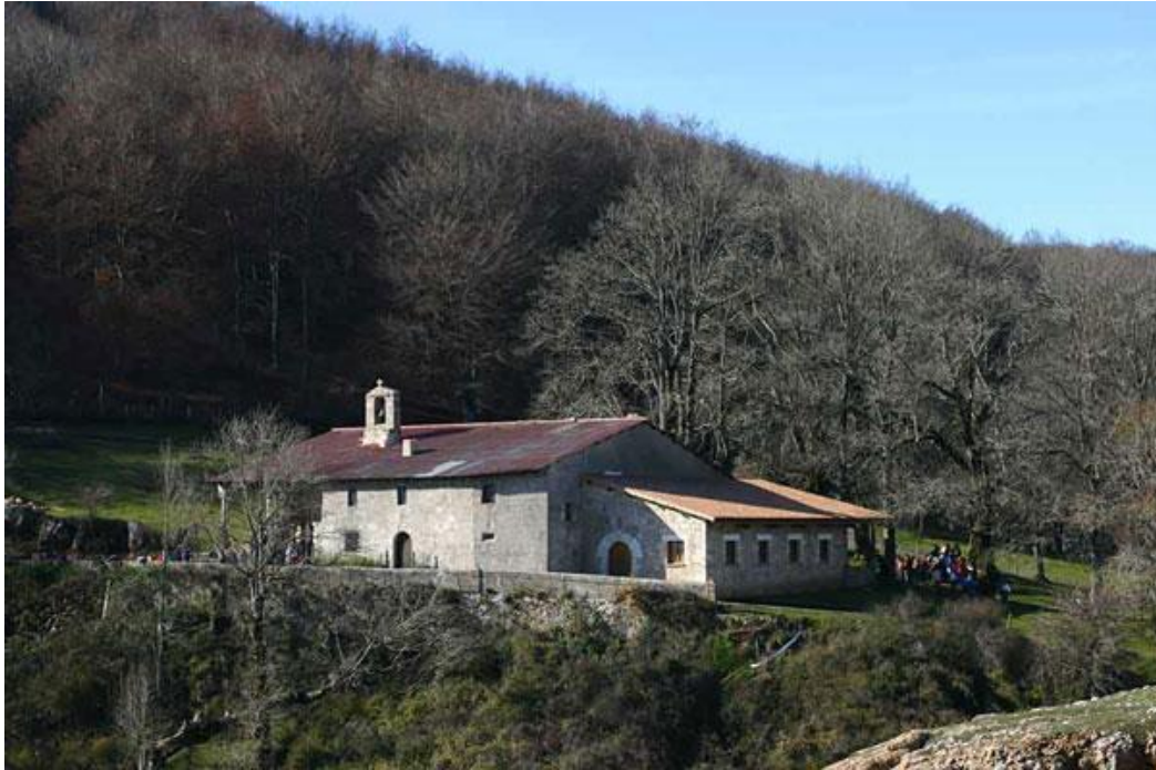
ERMITA SANTA TEODOSIA

El punto final para todos será el paraje de la Ermita de Santa Teodosia en su día refugio de caminantes y peregrinos en la hospedería aneja al templo, donde se iba para curarse de las enfermedades reumáticas.