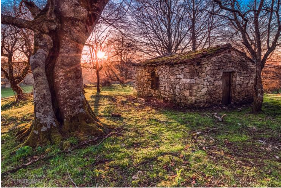
BORDA EN LOS RASOS DE OPAKUA

El autobús nos dejará en el Alto de Opakua en el punto kilométrico 36 de la carretera A2128 en su discurrir hacia la población de Kontrasta.