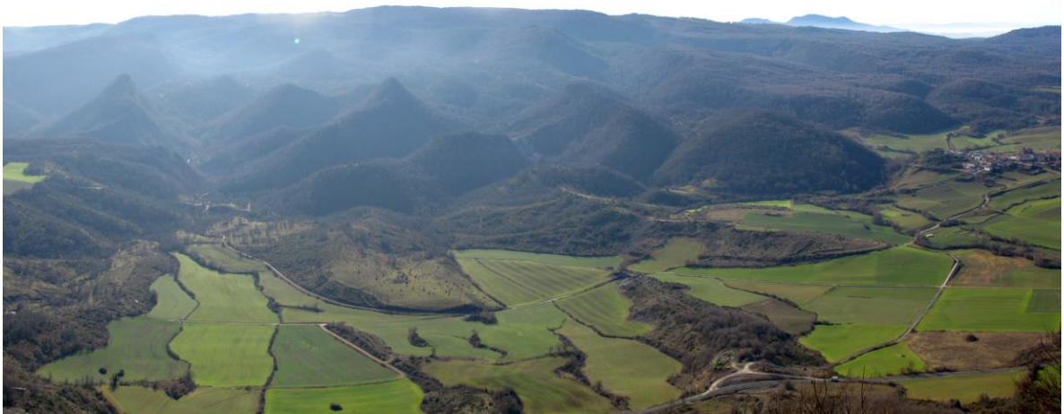
VALLE DE ARANA

El nacedero es la fuente principal del citado río y abastece de agua a Kontrasta. En su día y a través del viejo canal que recorreremos a lo largo de un par de kilómetros abastecía también de agua a todo el Valle de Arana y a Agurain.