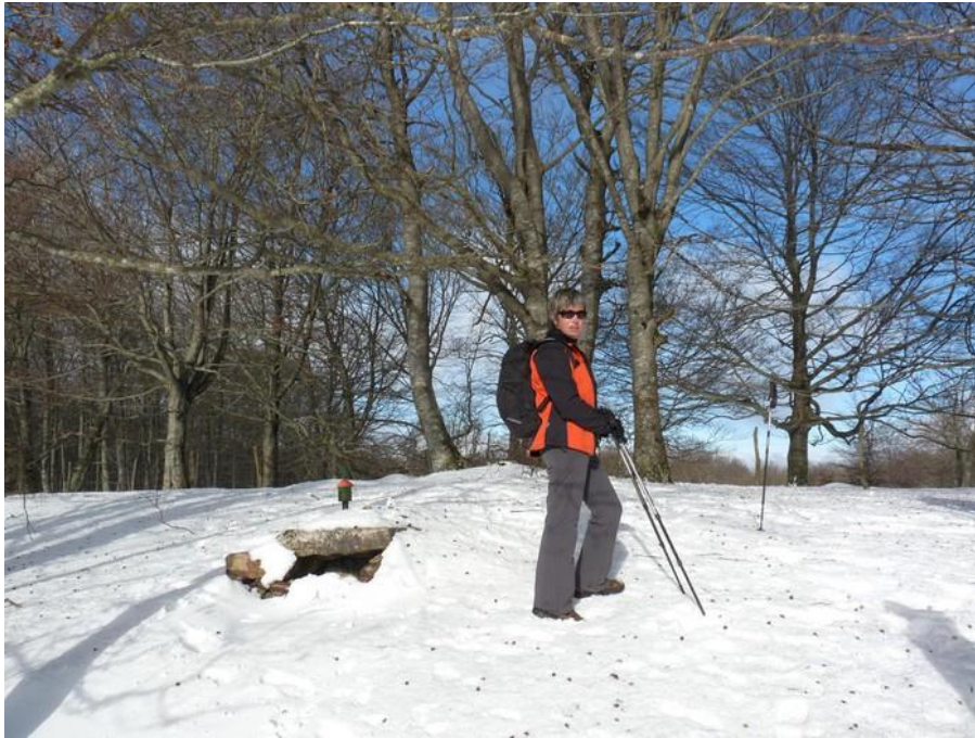
CIMA MONTE BITIGARRA