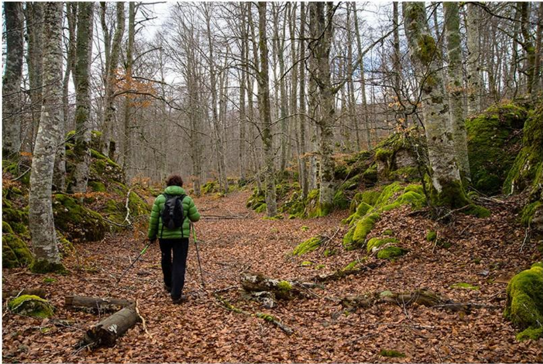
HAYEDO MONTES DE ITURRIETA

Seguido del Kapitate, Txandi, Bitigarra y Lezaundi. Todo ello siguiendo el cordal por encima del Valle de Arana con vistas a los pueblos de Ullibarri-Arana, Alda y San Vicente de Arana. Enfrente tendremos la bonita Sierra de Lokiz.