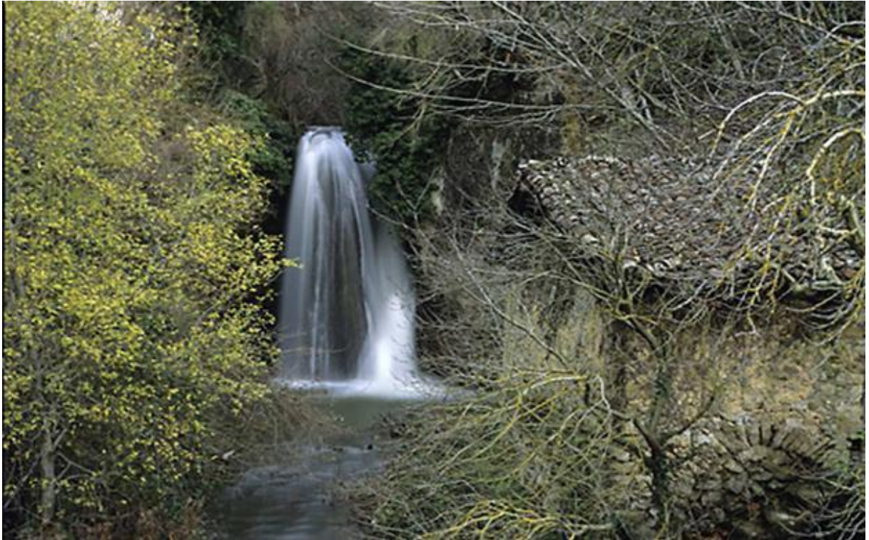
CASCADA DEL RIO ZARPIA

El nacedero es la fuente principal del citado río y abastece de agua a Kontrasta. En su día y a través del viejo canal que recorreremos a lo largo de un par de kilómetros abastecía también de agua a todo el Valle de Arana y a Agurain.