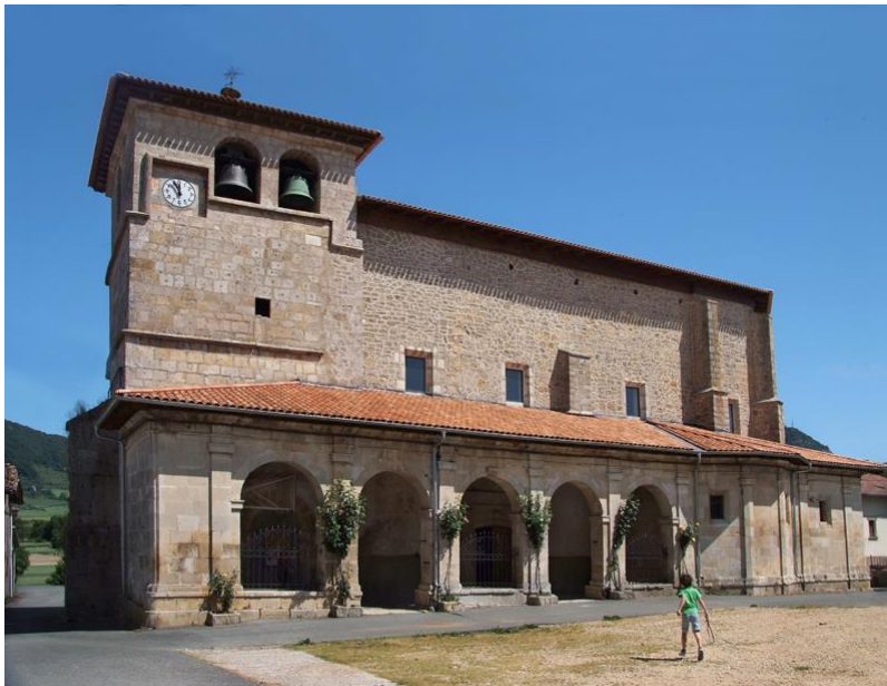
ULLIBARRI - ARANA